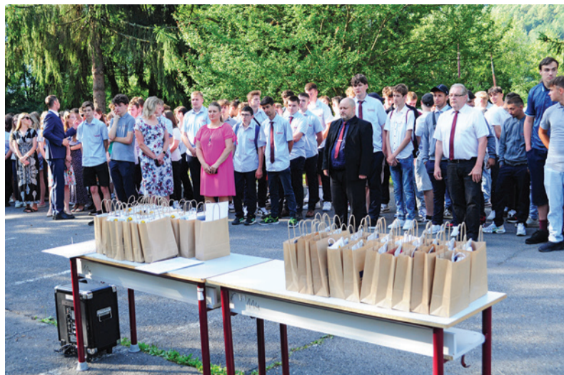
Slávnostný nástup žiakov pred ukončením školského roka.