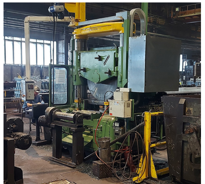
Pohľad na novú deliacu pílu č. 2 dodanú spoločnosťou Schubert GmbH.