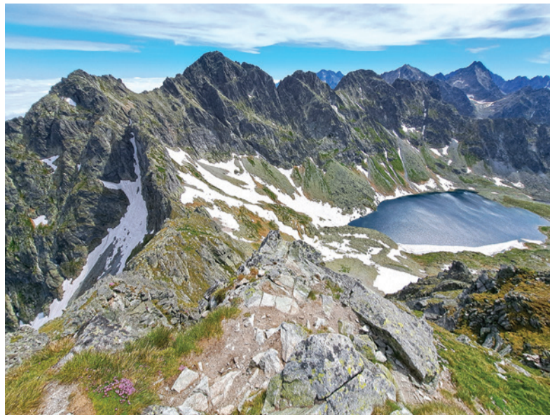
Pohľad z Kôprovského štítu.