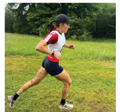
Trať v Králikoch bola plná blata, no našim pretekárom to neprekážalo.

biatlonisti presunuli na sústredenie do Poltára. „Boli sme si vyskúšať nový cyklochodník, ktorý otvára Banskobystrický samosprávny kraj. Našli sme tam 30 kilometrov ideálnych podmienok na bežecké lyžovanie – na kolieskových lyžiach. Navyše sme mohli bezpečne jazdiť aj na bicykloch, mali sme tiež dobré podmienky na cvičenie. Tento tréningový kemp hodnotím veľmi pozitívne. Športovci urobili veľké objemy a momentálne sa už pripravujú v Osrblí, kde strávime prvé dva prázdninové týždne,“ prezradil o príprave podbrezovských biatlonistov náš tréner.