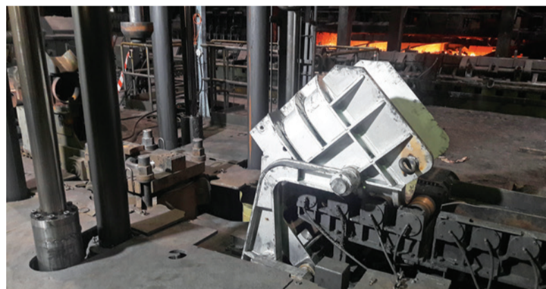
Vymenené vykladacie zariadenie dierovacieho lisu.

Na záver je možné konštatovať, že tak, ako aj pri predchádzajúcich opravách, odvieďli kolektívy všetkých zamestnancov zúčastnených na oprave veľké množstvo práce, za čo im zasluhuje patriť poďakovanie.