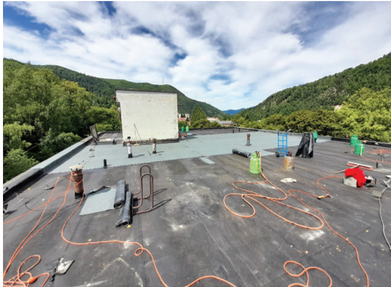
Počas opravy strechy budovy ŽP Informatika, s.r.o.

„Strecha bola podľa potreby už niekoľkokrát lokálne opravovaná, pričom boli odstránené akútne nedostatky. V súčasnosti ale už nebola v dobrom technickom stave, preto sme pristúpili k jej kompletnej obnove. Takto zrekonštruovaná strecha vydrží prakticky bez väčšej