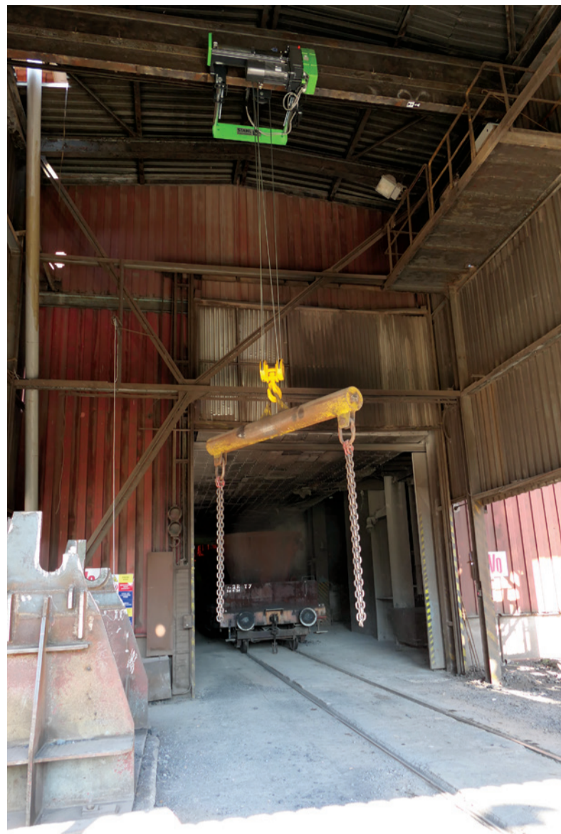
Podvesný kladkostroj na otáčanie troskových mís.