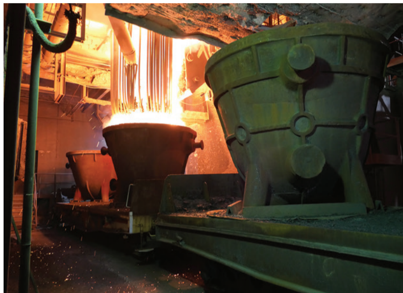
Zlievanie trosky z pece EAF do troskovej misy.

Všetky tri investičné akcie boli ukončené úspešnou úradnou skúškou. Inšpektor po preskúšaní uvedených zariadení odsúhlasil ich používanie v prevádzke.