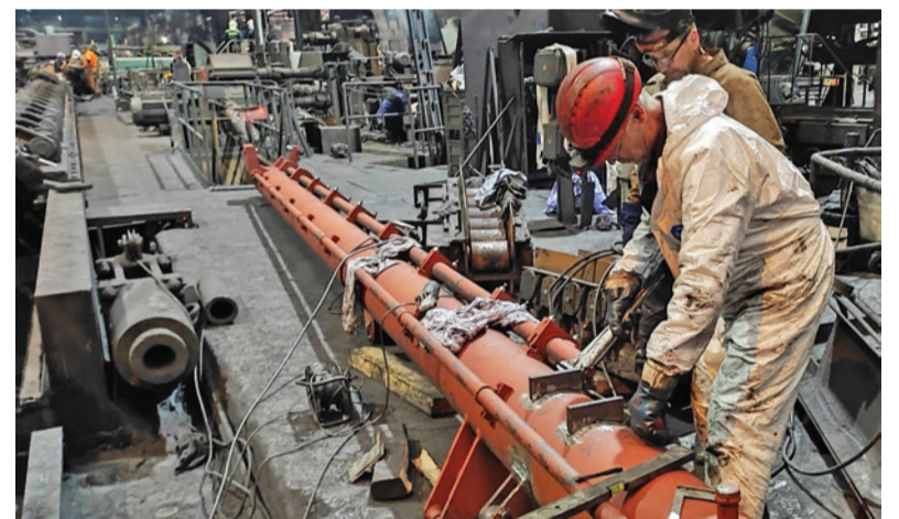
Montážne práce ramena vyťahovacieho zariadenia z karuselovej pece.

Väčšina úloh, ktoré sme naplánovali, bola zrealizovaná v požadovanej kvalite. Práce počas strednej opravy boli koordinované a riadené prostredníctvom každodenného riadiaceho štábu opravy. Odborné opravárenské úlohy boli riadené a organizované najmä riadiacimi zamestnancami centrálnej údržby pre valcovňu bezšvíkových rúr. Organizácia prác pomocného charakteru, ako čistenie výrobných priestorov, bola riadená riadiacimi zamestnancami valcovne bezšvíkových rúr.