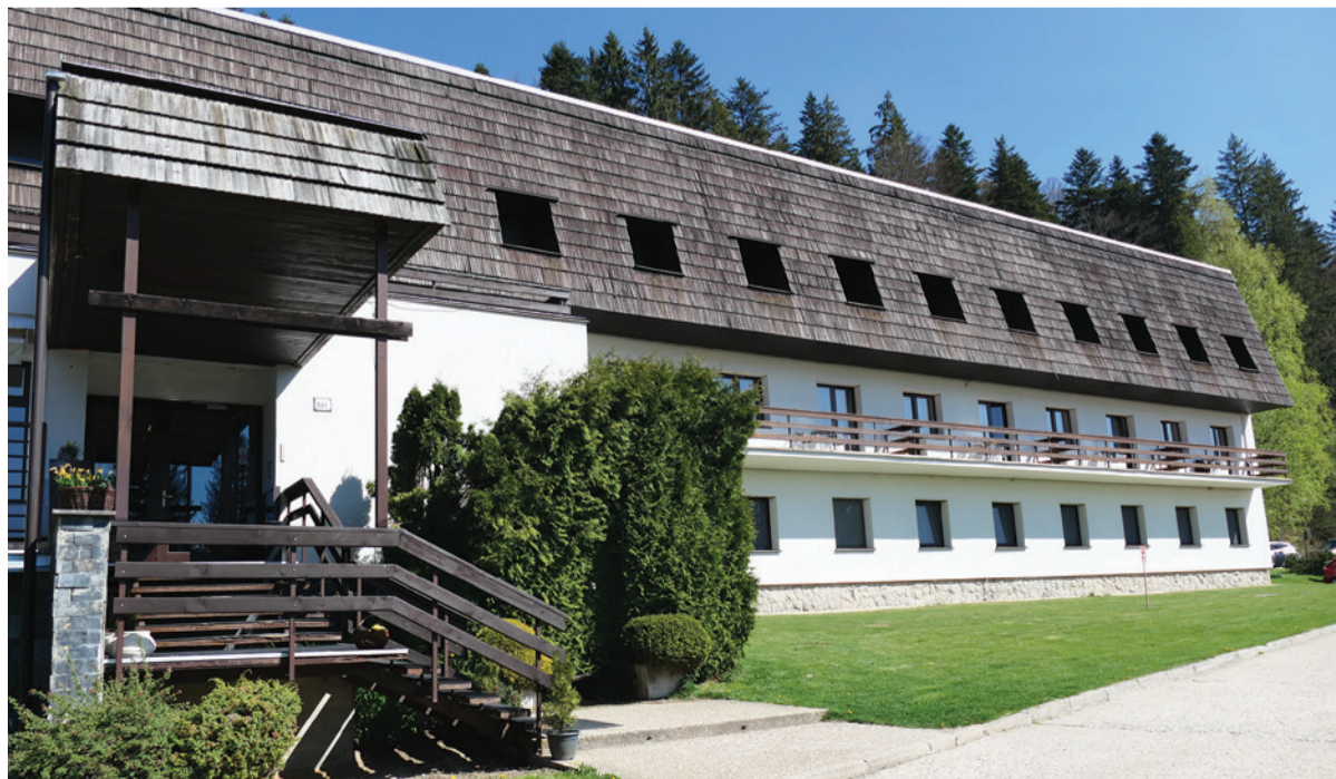
Hotel Stupka na Táľoch.

Mnohí naši kolegovia pracujú v železiarniach niekoľko rokov, a tak sa pobytovcov zúčastňujú pravidelne. „Hoci je zabezpečenie rekondičného pobytu povinnosťou zamestnávateľa, naši zamestnanci ho dlhodobo vnímajú ako určitý benefit, keďže si môžu oddýchnuť a zregenerovať svoje telo. Ich reakcie sú zväčša pozitívne,“ pokračovala M. Bardelčíková a dodala, že v druhom polroku sa pobytu na Táľoch zúčastní ďalších približne dvesto zamestnancov.