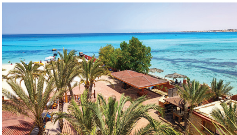
Dovolenka v Egypte, časť Marsa Matrouh.