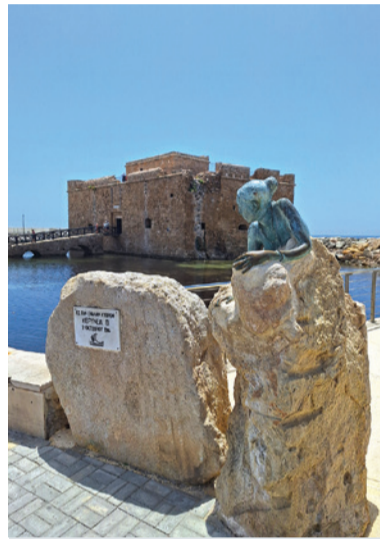
Pafoská pevnosť (pamiatka UNESCO) na Cypre.

V minulom čísle Podbrezovana sme vás prostredníctvom editoriálu vyzvali, aby ste nám posielali zábery z dovoleniek, výletov alebo iných aktivít realizovaných počas leta. Teší nás, že prví z vás sa už zapojili a podelili sa o svoje zážitky aj s ostatnými čitateľmi nášho dvojtýždenníka. Budeme radi, ak nám do redakcie budete počas leta aj naďalej posielat svoje letné fotografie, či už z dovolenky pri mori alebo pobytu v horách, prípadne relaxu vo svojej záhrade. V niektorom z ďalších vydaní novin uverejníme vaše najviac vydarené zábery.