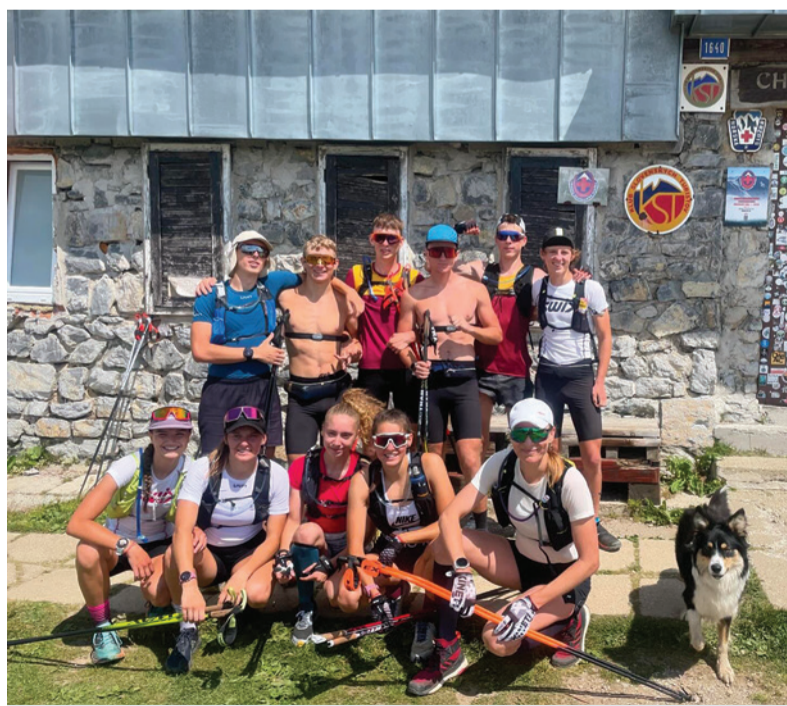
Mladí biatlonisti počas tréningu s Nastou Kuzminovou na Štefáničke.