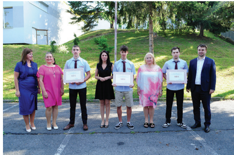
Okrem vysvedčení si žiaci prevzali aj viaceré ocenenia.