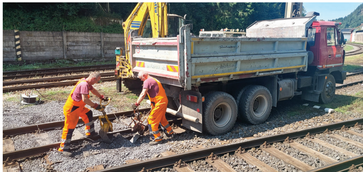
Zamestnanci dopravnej služby počas prác na železničnej vlečke.

V rámci generálnej opravy bude začiatkom augusta realizovaná komplexná výmena výhybky číslo 13 a príslušných koľajových polí v dĺžke 70 metrov.