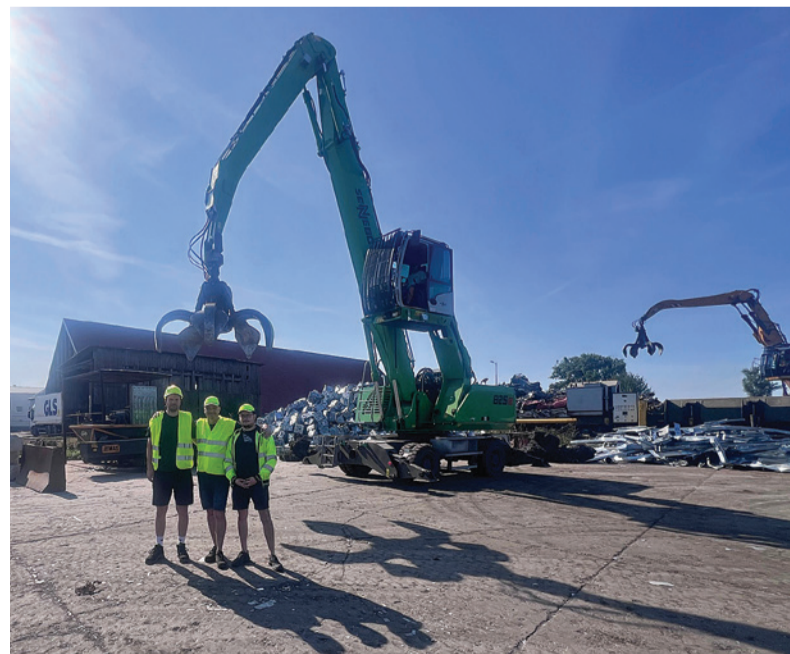
Pracovníci prevádzky KBZ s.r.o. v Zohore.