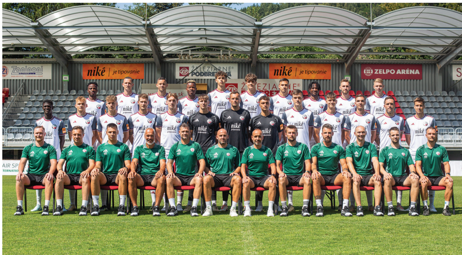
Hráčsky a realizačný tím FK Železiarne Podbrezová pred začiatkom sezóny 2024/25.