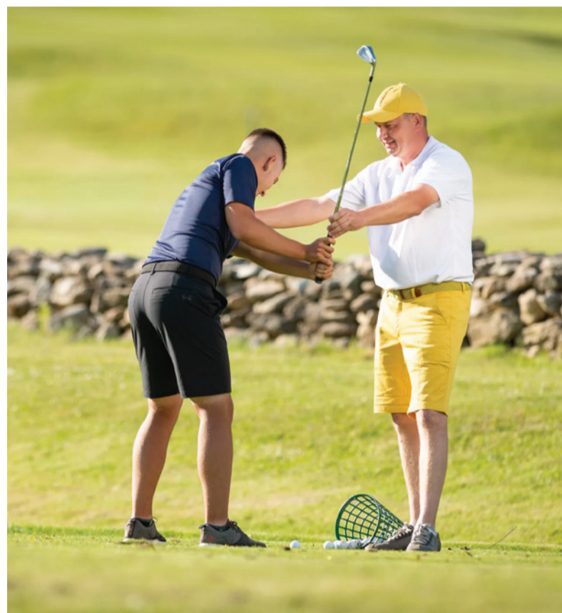
Pri golfe sa dokonale precvičujú končatiny a chrbtica.