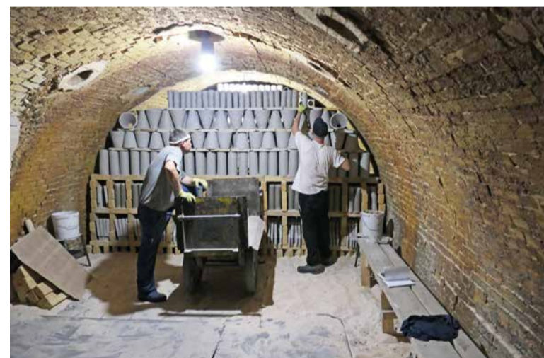
Prioritou vedenia spoločnosti je udržať zamestnanosť.

- Bohužiaľ, áno. Významne sme preto okresali investičný plán. Podarilo sa nám však dokončiť prestavbu a modernizáciu filtračných zariadení FTG. Išlo o náročnú investíciu nielen z pohľadu financií, ale aj z dôvodu administrácie. Bolo potrebné vyriešiť veľké množstvo