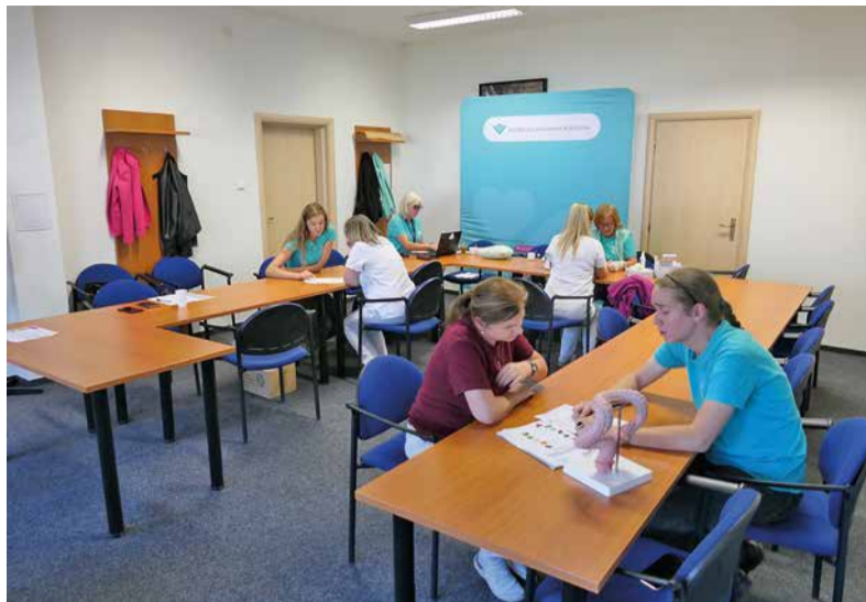
Počas Dní zdravia v starom závode, v zasadačke budovy energetiky.

V rámci vyšetrení si naši zamestnanci nechali zmerať svoje telesné hodnoty prístrojom InBody, z ktorého výsledkov im odborník poskytol i kompletnú analýzu ľudského tela. Taktiež mali možnosť zmerať si krvný tlak, hladinu cholesterolu z kvapky krvi či dozvedieť sa viac o prevencii rakoviny hrubého čreva. Ani tento rok nechýbalo jeho poradenstvo, počas ktorého lekárka kontrolovala znamienka a stav kože. V prípade záujmu sa mohli zamestnanci dozvedieť viac