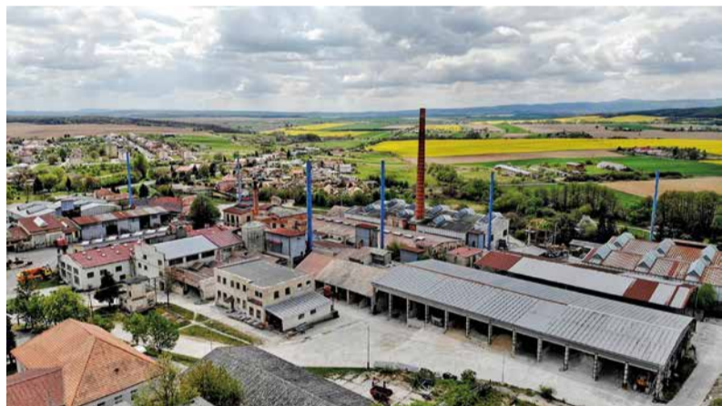
Fabrika v Kalinove má podľa riaditeľa osobitné čaro.