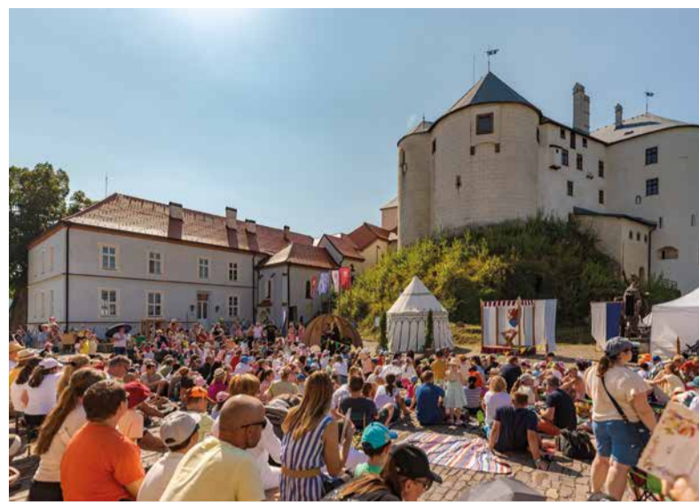
Sprievodené podujatia na hrade Ľupča sa tešia veľkej obľube.

„V jesenných mesiacoch bude sprístupnený dolný hrad bez komentovanej prehliadky, a to každý deň, okrem pondelka. Počas všetkých víkendov a sviatkov, až do konca novembra, poskytujeme návštevníkom aj lektorský výklad v hodinových intervaloch počas