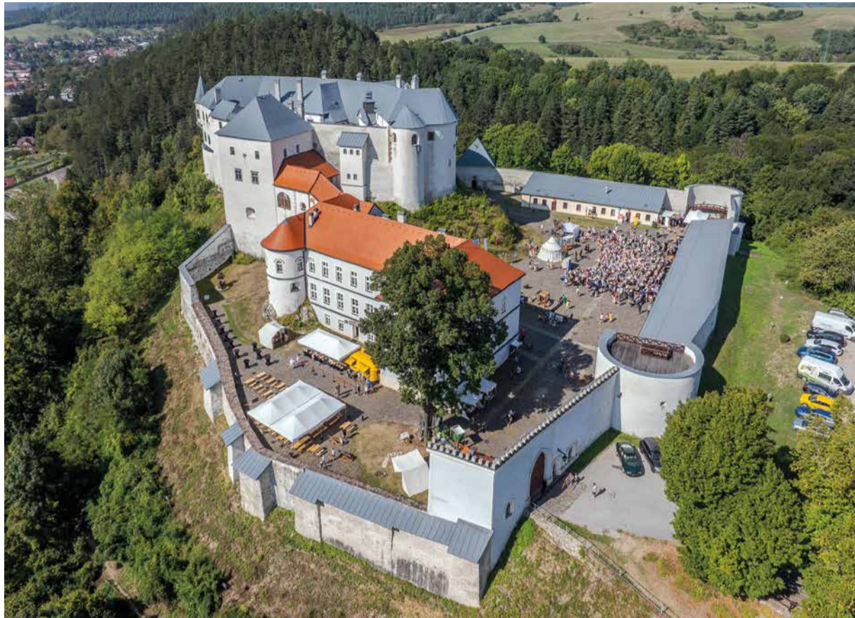
Hrad Ľupča počas podujatia Dračie dni.