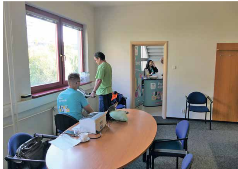
Vyšetřenie prístrojom InBody.

- Som tu prvýkrát, predtým som na takomto vyšetření nebol. Je to blízko od miesta, kde pracujem, preto som využil túto možnosť. Chcel som sa dozvedieť niečo o svojom zdraví a som rád, že v rámci preventívnych vyšetření dopadlo všetko dobre. Síce som to