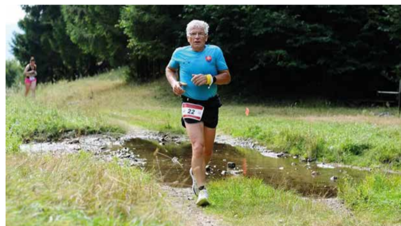
Začiatkom septembra zabehol aj Helfpiansky kros.