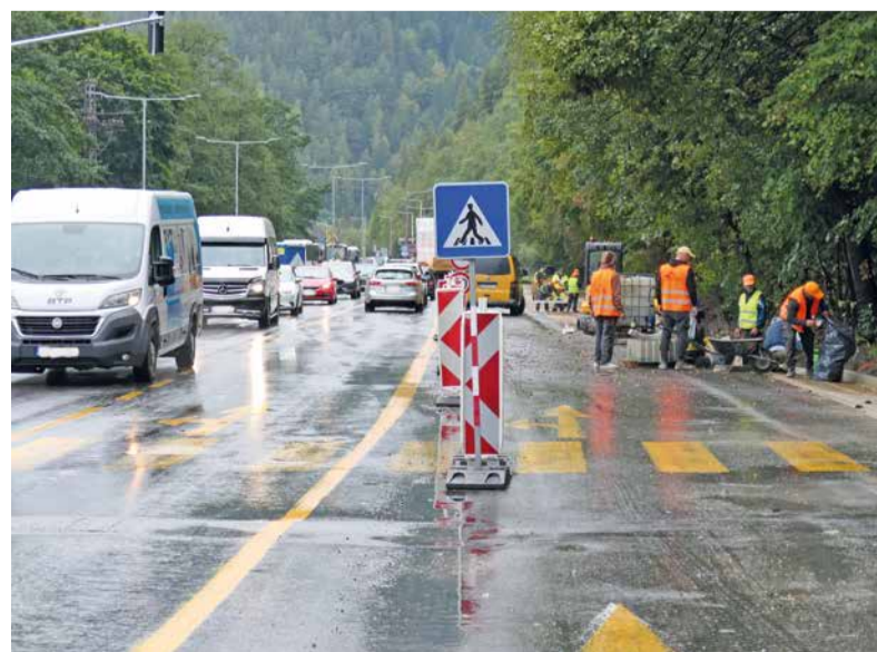
Práce na ceste I/66 v Podbrezovej idú podľa harmonogramu. Začiatkom októbra položia na vozovku nový asfalt.

O ďalších prípadných novinkách ohľadom rekonštrukcie cesty I/66 v Podbrezovej vás budeme informovať.