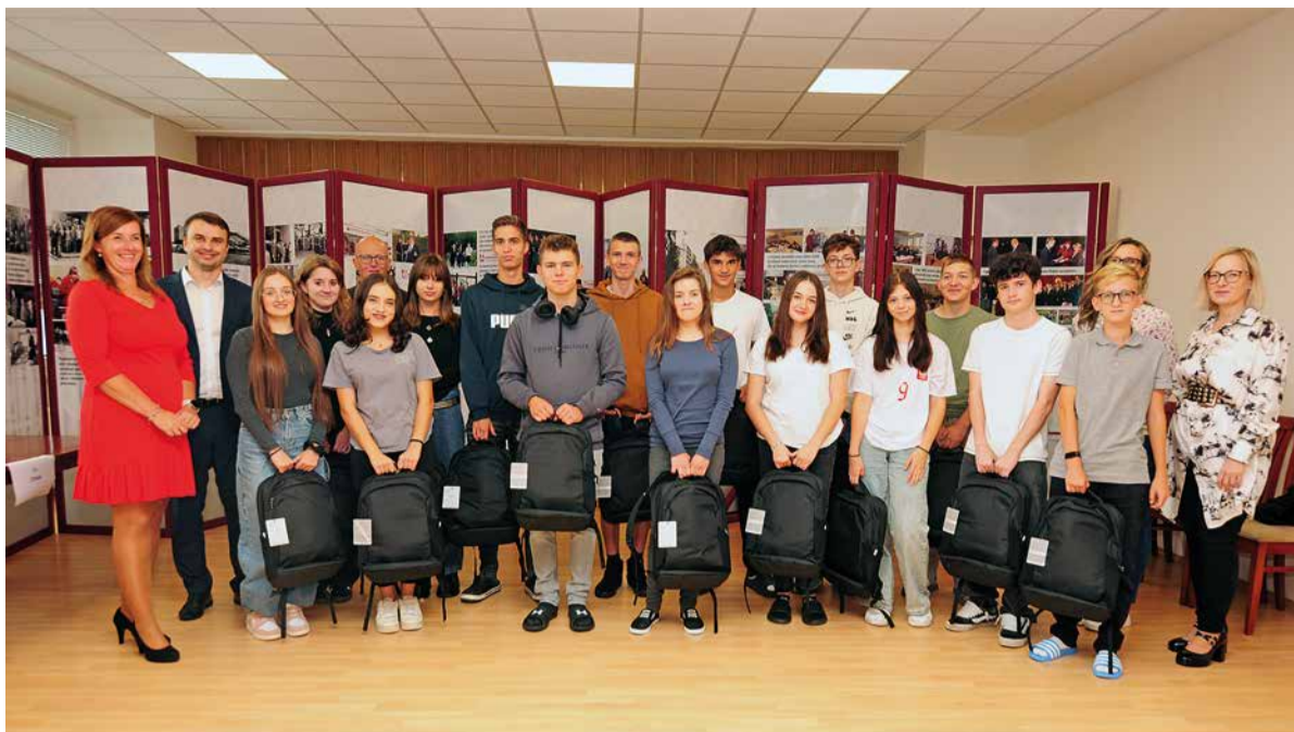
Prváci gymnazisti po prevzatí nových notebookov.