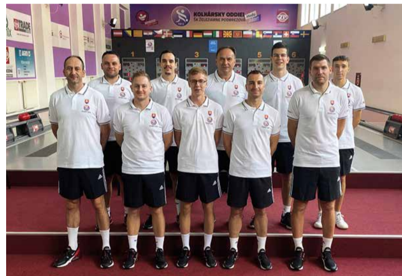
Družstvo mužov chce uspieť vo Svetovom pohári i Lige majstrov.

rok – postúpiť do prvej štvorky vo Svetovom pohári a potom aj v Lige majstrov. Do Svetového pohára sa prihlásilo pätnásť družstiev, z toho minimálne osem má na to, aby postúpilo medzi najlepšie štyri tímy. Ženských družstiev je trinásť a taktisto je tam väčšia konkurencia v porovnaní s minulým rokom. Naše kolkárky skončili vlni ôsme, tento rok verím, že sa dostanú do prvej osmičky a postúpia tak aj do Ligy majstrov.