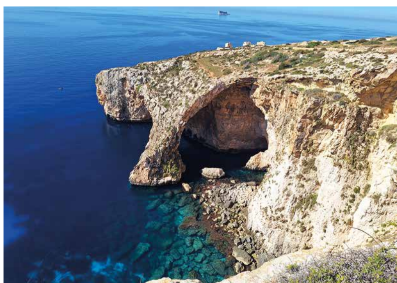
Nádherné prírodné úkazy na ostrove Malta.