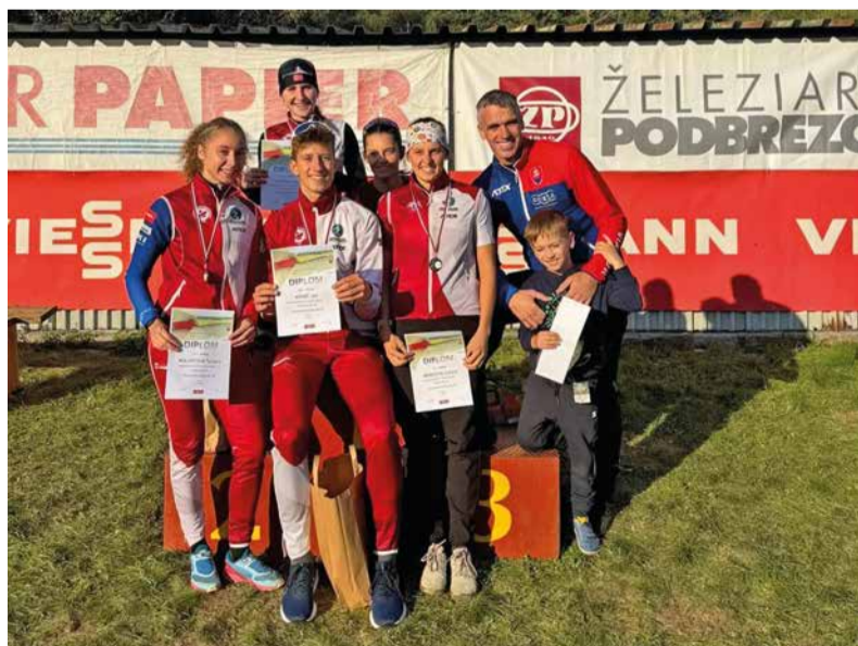
Podbrezovskí biatlonisti boli v Revúcej úspešní.