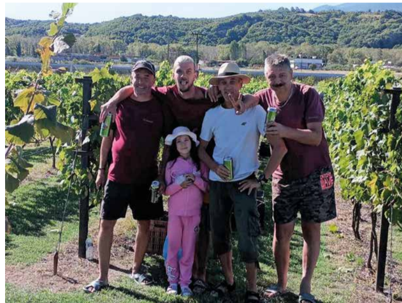
Naši kolegovia počas dovolenky nielen oddychovali, ale aj pomáhali miestnemu gazdovi vo vinici.

„Boli sme spolu prvýkrát a všetkým sa nám páčilo. Spoločné chvíle na dovolenke sme si naplno užili a už teraz sa tešíme, ako pôjdeme opäť,“ uzavrel M. Malček.