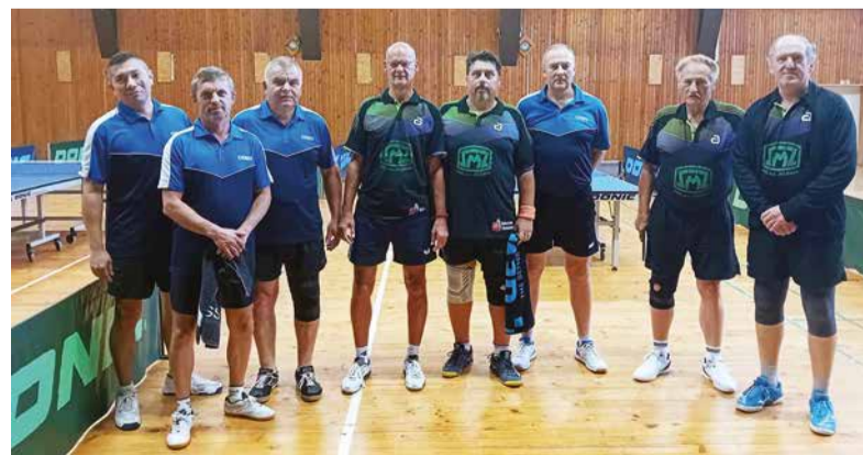
Pred zápasom medzi družstvami Dubová-Podbrezová „A“ a Revúca „B“ v 3. lige.

V závere septembra začali svoje súťaže všetky tri družstvá. „A“-tím začal svoje účinkovanie v tretej lige, kde je nováčikom, domácom víťazstvom nad Revúcou „B“. V piatej lige sa „béčko“ stretlo doma s Podlavicami „C“ a taktiež začalo novú sezónu výhrou. „Céčko“ privítalo v domácom prostredí družstvo Cobra Banská Bystrica, ktorému tesne podľahlo.