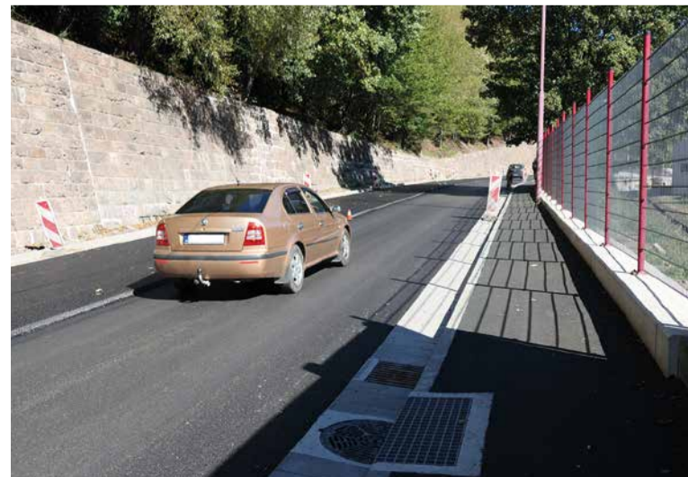
Súčasťou rekonštrukcie bolo aj vybudovanie nového chodníka pre peších.

Vedenie akciovej spoločnosti Železiarne Podbrezová umožnilo svojim zamestnancom vstup do areálu starého závodu cez dočasné strážne stanovišťa na bráne pod kostolom a pri odbočke na Piesok (tzv. brána „remíza“). V spolupráci so ŽP Bezpečnostnými službami tak vedenie vyšlo v ústrety prichádzajúcim, ale aj odchádzajúcim pracovníkom vyhnúť sa tvoriacim kolónam.