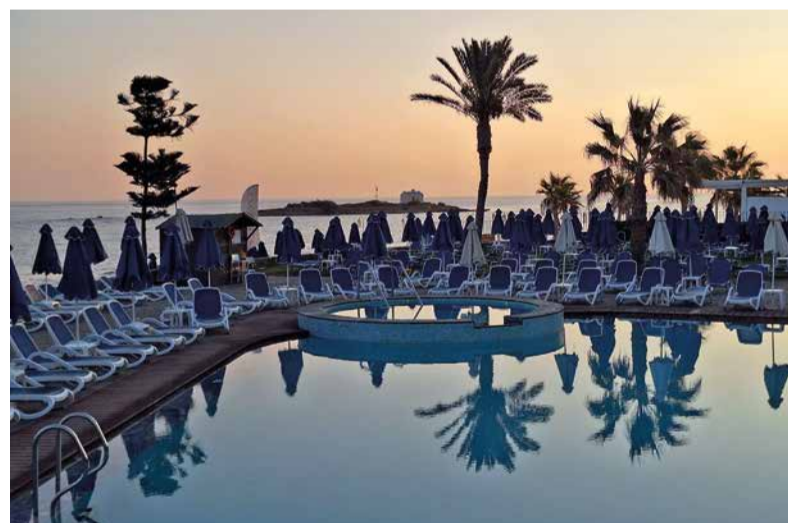
Večerný oddych na Kréte.