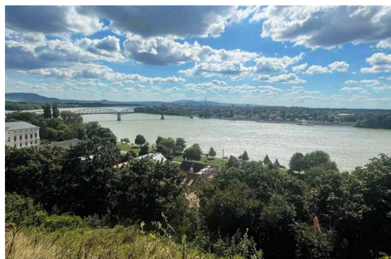
Dovolenka v Štúrove.