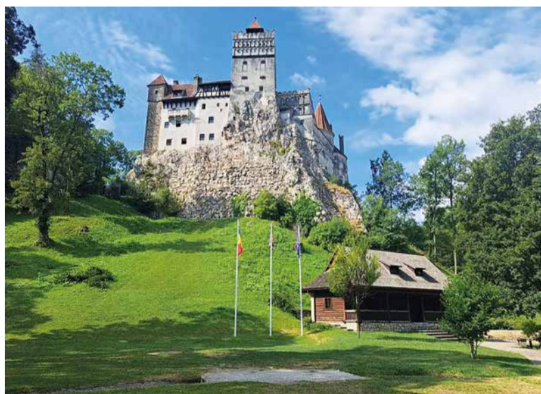
Hrad Bran v Rumunsku – Drakulov hrad.

ďaleko a využili možnosť navštíviť nádherné prostredie nášho okolia. V týchto dňoch je už leto definitívne za nami. Jeseň je však najfarebnejšie a najfotogenickejšie ročné obdobie, preto vás opäť vyzývame, aby ste sa pochválili svojimi zábermi. V niektorom z ďalších vydaní novin potom opäť uverejníme vaše fotografie.