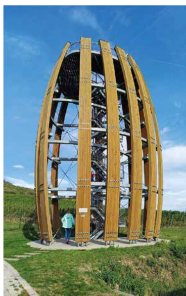
Vyhlídková veža Tokaj v obci Malá Třňa (okres Trebišov).