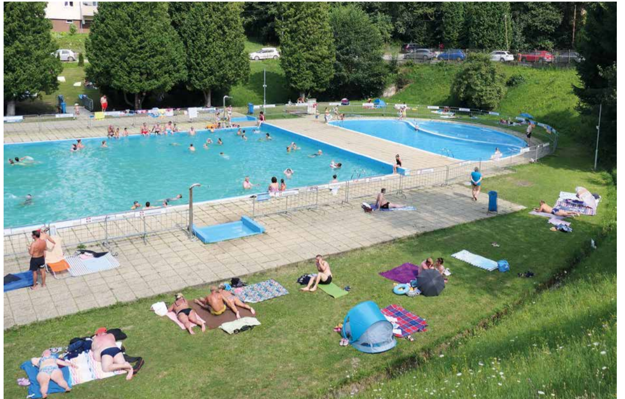
Letné kúpalisko v Podbrezovej vyhľadávali nielen ľudia z obce, ale aj návštevníci z blízkeho i širšieho okolia.

S letnou sezónou sa spája aj permanentná starostlivosť o bazény i celý areál. „Neustále musíme dbať na čistotu a kvalitu vody. Počas noci čistí dno veľkého bazéna vysávač. Správcovia prichádzali každé ráno už o šiestej, aby vyčistili filter a vrátili vysávač späť do vody až do otvorenia brán areálu. Taktiež je pri prevádzke kúpaliska nevyhnutný rozbor vody, pričom na základe vzoriek vieme, koľko chlóru a pH obsahuje. Zároveň je potrebné v malých bazénoch meniť vodu každý deň,“ vysvetlila riaditeľka Športového klubu Železiarne Podbrezová.