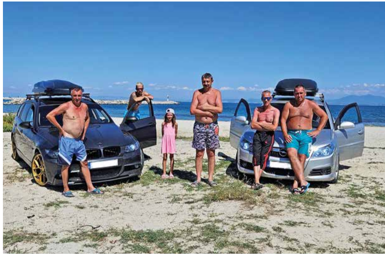
Zamestnanci ŽP a.s. počas spoločnej dovolenky.

„Sme veľmi dobrí kamaráti. Každý z nás, ak má možnosť, ochotne a rád pomôže druhému. Pravidelne chodím na Olympskú riviéru s rodinou, konkrétne do mesta Paralía. No nikdy sme neboli ako partia. Keďže spolu dobre vychádzame, prišiel som s nápadom, či nepôjdeme na dovolenku. Potešilo