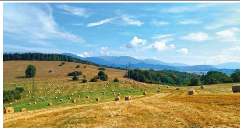
Všade dobre, doma najlepšie. Záber zo Zuberštína v Podbrezovej.