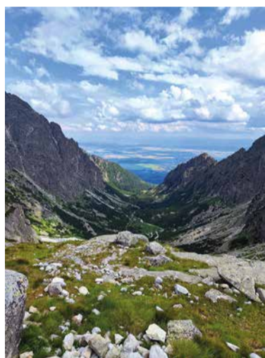
Výhľad z Téryho chaty na Malú Studenú dolinu.