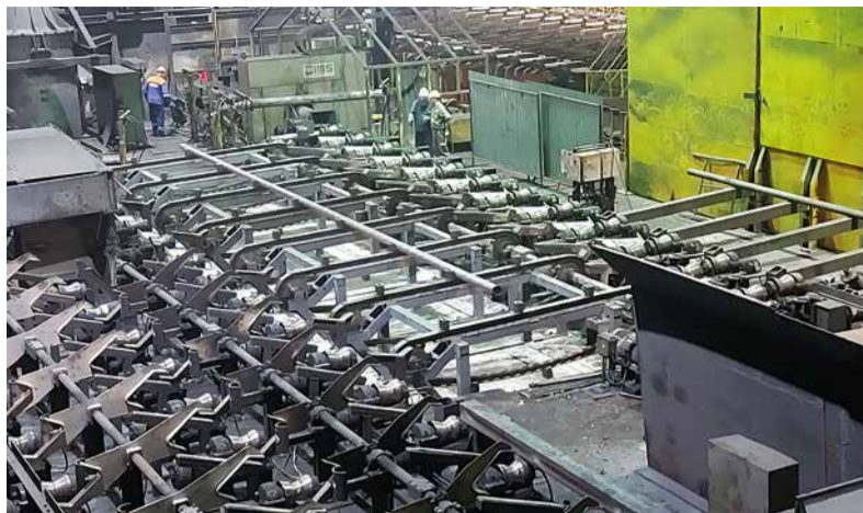
Reťazový vlečník dopravy lúp úseku kabíny č. 6.

Príprava strednej opravy spočívala v objednaní, nákupe a výrobe požadovaných materiálov, náhradných dielov, ako aj v príprave interných a externých výkonov pre zrealizovanie naplánovaných opravárenských prác. Na oprave sa podieľali interní zamestnanci valcovne bezšvíkových rúr, centrálnej údržby valcovne bezšvíkových rúr, hlavnej mechanickej dielne centrálnej údržby, elektroservis, automatizácie, energetiky, dopravy, zásobovania a závodného hasičského zboru. Okrem interných zamestnancov nám počas opravy pomáhali aj externí zamestnanci, a to z TEPLOTECHNA PRŮMYSLOVÉ PECE, s.r.o., Montáže Trenčín, s.r.o., Stainless Master, s.r.o., Hutných montáží Košice, s.r.o., ECO NEXT, s.r.o., Rohrer-Impera, s.r.o., Pvssteel s.r.o., NORISSON s.r.o., WAFAREX, s.r.o., LubTec-SK, s.r.o., Staso DZ s.r.o., SUNIK, s.r.o., BBF elektro, s.r.o., ELEKTRICKÉ SYSTÉMY, spol.s.r.o., ABB, s.r.o., Framag GmbH a SMS Group GmbH. Na uvedené firmy sme sa obrátili s požiadavkou o pomoc z úzko špecializovaných, ale aj kapacitných dôvodov.