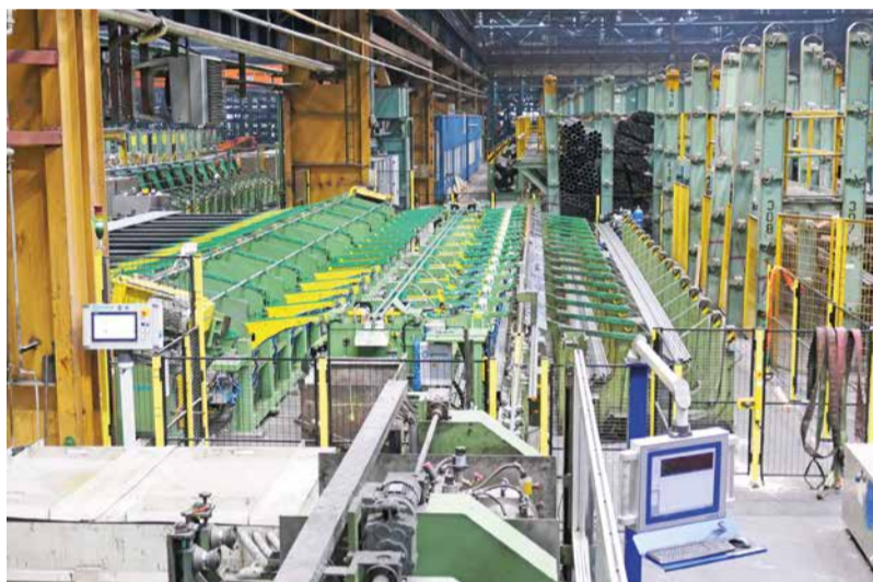
Ďalšia linka v ťahárni rúr bola doplnená o orezávanie neskusovaných koncov a odstraňovanie otrepov po delení.