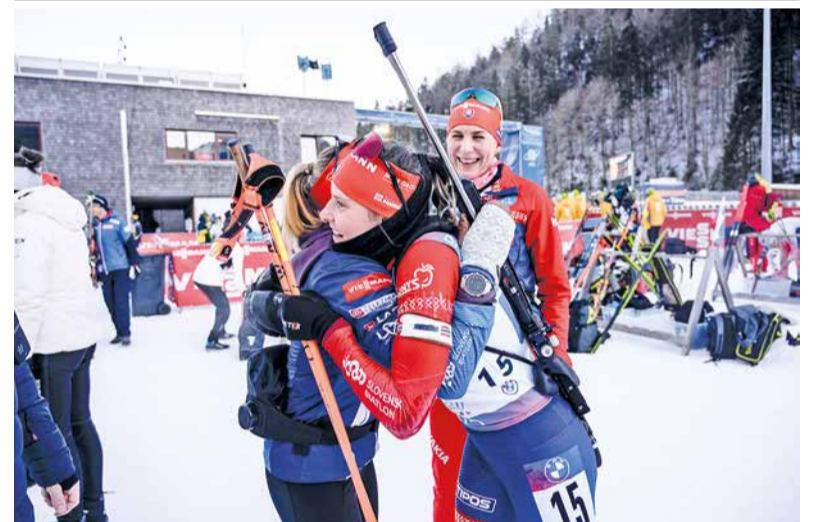
Radosť našich biatlonistiek v cieľi.