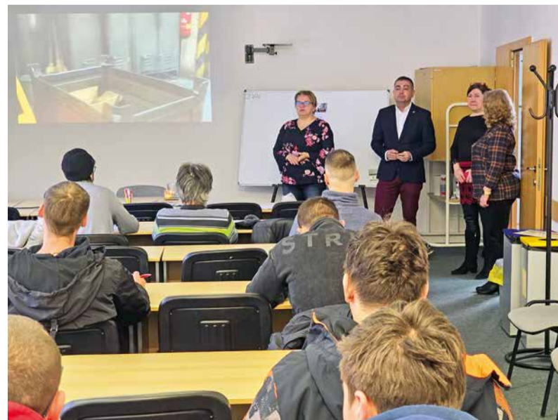
Počas miniburzy práce.

„Traja z nich už v priebehu mesiaca január nastúpia do prevádzkarne ťahárne rúr. Desať uchádzačov bude pozvaných na ďalšie osobné pohovory. Niektorí z nich ešte musia ukončiť rekvalifikačné kurzy organizované ÚPSVaR. Aby mohli u nás pracovať, musia tiež prejsť lekárskou prehliadkou, respektíve psychotestami,“ dodala na záver M. Ťažká.