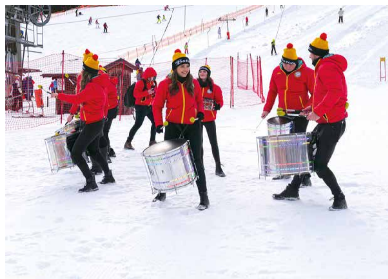
Bubnové zoskupenie Batida predviedlo skvelú šou.