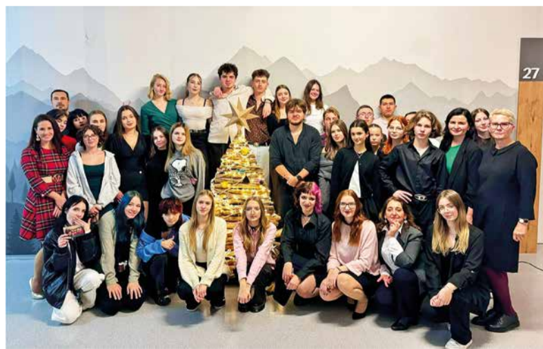
Naši žiaci mali v Poľsku bohatý program.

Náš výlet sa začal v nedeľu, keď sme v poobedných hodinách prišli do hotela, navečerali sa s vedením našej partnerskej školy a oddychovali. V priebehu štyroch nasledujúcich dní sme stihli naozaj mnoho. Hneď v pondelok sme sa zoznámili s našimi poľskými kamarátmi a predstavili sme si navzájom hravou formou obe naše krajiny a školy. Tiež sme navštívili múzeum „bombiek“, čiže vianočných gúľ, kde boli gule naozaj rozmanité – od prírod-