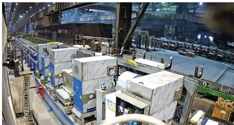
Prebiehajúca montáž kotlovej linky číslo 1 vo valcovni bezšvíkových rúr.