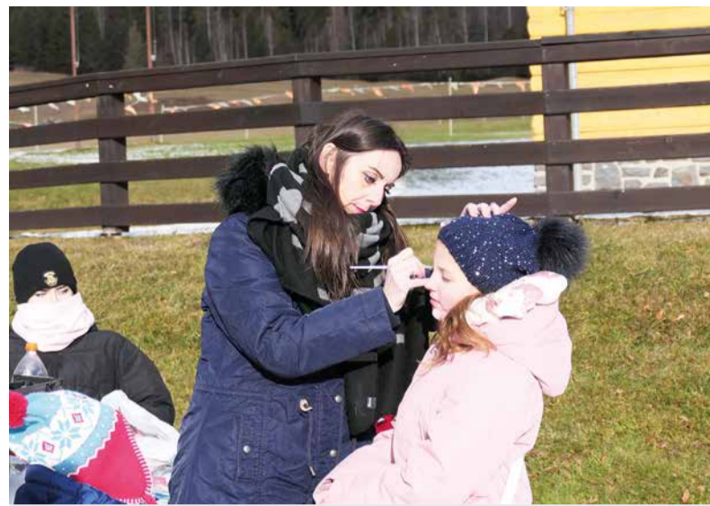
Obľúbenou aktivitou počas otvorenia sezóny bolo maľovanie na tvár.

Zimná sezóna na Táloch je teda otvorená. Vedenie rezortu i všetci zamestnanci strediska dúfajú, že bude rovnako úspešná ako vlaňajšia. Takisto veria, že skutočná zima ešte len príde a každý, kto do obľúbeného strediska zavíta, si vychutná nezabudnuteľné chvíle v nádhernom prostredí pod Nízkymi Tatrami.