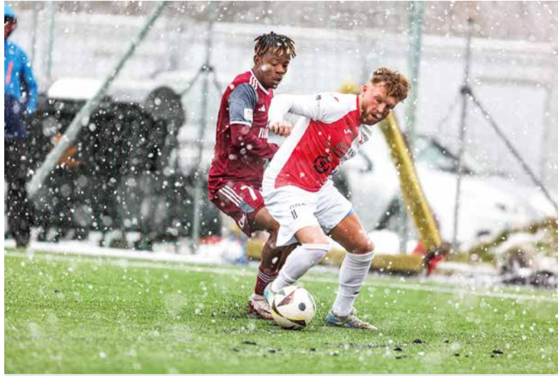
Počas zápasu s Kroměřížom spestrilo zápas pravé zimné počasie.