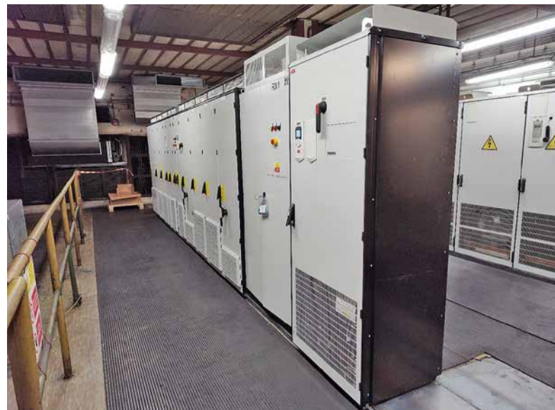
Nové meniče pre pohon a tlačky elongátora.

Okrem spomínaných prác boli realizované aj ďalšie úlohy. Pred elongátorom boli vymenené reťaze, vrátane hnacích a hnacích kolies, vymenený bol vozík tlačky. Najväčšie práce elektroúdržby spočívali v realizácii investičnej akcie, a to vo výmene meničov a riadiaceho systému pre pohon elongátora o výkone 2,4 MW a pohonu tlačky elongátora o výkone 125 kW, kde pôvodné komponenty od firmy ALSTOM sme nahradili meničmi ACS880 a riadiacim systémom S800 od firmy ABB. Zrealizovaná bola aj generálna oprava na vyťahovačom ramene z Karuselovej pece, kde sa stýkače nahradili meničmi ACS880 od firmy ABB, pre dynamické brzdenie elektromotorov vyťahovacieho ramena. Ďalšie prevedené práce spočívali v revízii 6 kV elektromotorov a výmene odporníka pre rozbeh 6 kV elektromotora odvalcovacej stolice za nový typ MFA1/500A od ABB.