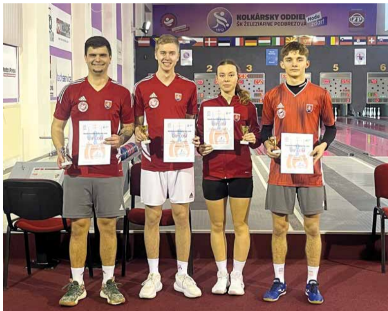
Naši medailisti z juniorských kategórií.