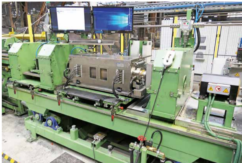
Nový ultrazvuk na úpravárenskej linke v ťahárni rúr.

- V ťahárni rúr sme počas celého roka fungovali v nepretržitom pracovnom režime. Úpravňa na dielni 1 pracovala v dvojzmenom pracovnom režime, okrem úpravárenských liniek, ktoré taktiež pracovali v nepretržitom pracovnom režime. Od júna sme boli nútení zoptimalizovať normu obsadenia zamestnancov na objem zákaziek, ktorý sme mali k dispozícii. Celková výroba v ťahárni rúr bola 41 339 ton, čo predstavuje naplnenosť objemu oproti celkovej kapacite na 78 percent. Galvanizačná linka pracovala prvé štyri mesiace v dvojzmenom pracovnom režime, od piateho mesiaca iba v prvej zmene. Počas celého roka pozinkovala 785 ton. Druhovýroba pracovala prvých päť mesiacov na tri zmeny, od šiesteho mesiaca v dvojzmenom